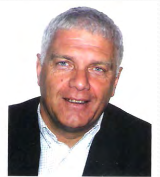
Alain Mager Marketing & Animations